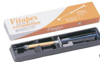
Vitapex náplň 2 g stříkačka