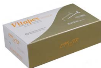
Jednorázové prostředky Mini stříkačky 20 stříkaček a pístů