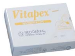
Jednorázové konce aplikátoru 40 konců aplikátoru / balení