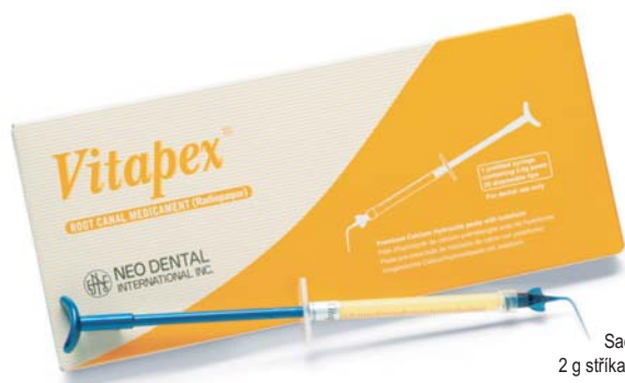
Vitapex Sada konců aplikátoru 2 g stříkačka + 20 konců aplikátoru